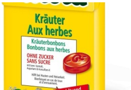
Ricola Kräuterbonbons - Original Herb. Die Verwendung dieses Bildes ist fuer redaktionelle Zwecke honorarfrei. Lebensmittel, Produkte, People