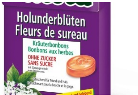
icola Kräuterbonbons - Elderflowers. Die Verwendung dieses Bildes ist fuer redaktionelle Zwecke honorarfrei. Abdruck unter Quellenangabe: "obs/Ricola AG". Lebensmittel, Produkte, People

Diese Meldung kann unter https://www.presseportal.ch/de/pm/100005111/100568355 abgerufen werden.