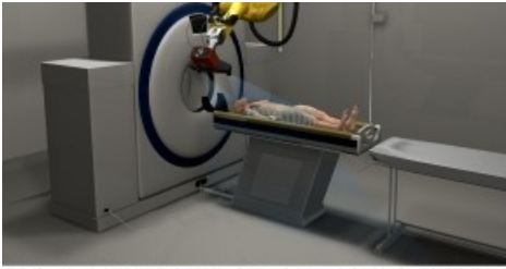
Ein hochbeweglicher Industrieroboter namens 'Virtobot' zeichnet die Konturen einer zu untersuchenden Leiche auf. Durch den gleichzeitigen Einsatz von Computertomographen erhalten die Gerichtsmediziner ein dreidimensionales Bild und können die Leichen digital konservieren.

Ein hochbeweglicher Industrieroboter namens 'Virtobot' zeichnet die Konturen einer zu untersuchenden Leiche auf. Durch den gleichzeitigen Einsatz von Computertomographen erhalten die Gerichtsmediziner ein dreidimensionales Bild und können die Leichen digital konservieren. Un robot industriel extrêmement souple, baptisé 'Virtobot', enregistre les formes du cadavre à examiner. Le recours simultané à la tomodensitométrie fournit aux médecins légistes une image en trois dimensions, permettant ainsi la conservation numérique des corps. A high-mobility industrial robot by the name of Virtobot records the contours of a cadaver under examination. Using computed tomography at the same time, forensic doctors are provided with a three-dimensional image and can conserve corpses digitally.