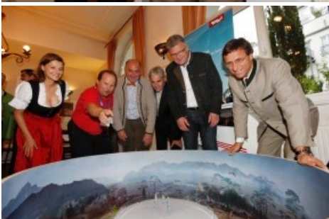
BILD zu TP/OTS - Anlaesslich der RDA Messe in Koeln, der Messe des Internationalen Bustouristik Verbandes, organisierte die Tirol Werbung einen informativen Tirol Abend. Anwesend waren 50 internationale Medienvertreter, Vertreter aus der Busreise- und Gruppentouristikbranche sowie Partner aus Tirol. / Weiterer Text ueber ots und auf http://www.presseportal.ch . Die Verwendung dieses Bildes ist fuer redaktionelle Zwecke honorarfrei. Veroeffentlichung unter Quellenangabe: "obs/Tirol Werbung GmbH".

Diese Meldung kann unter https://www.presseportal.ch/de/pm/100000449/100701458 abgerufen werden.