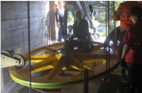
Schilthornbahn AG: Neue Umlenkräder eingebaut. Das neue Umlenkrad wird direkt mit dem Lastwagenkran in die Station gehoben. / Weiterer Text ueber ots und auf http://www.presseportal.ch . Die Verwendung dieses Bildes ist fuer redaktionelle Zwecke honorarfrei. Veröffentlichung unter Quellenangabe: "ots.Bild/Schilthornbahn AG".