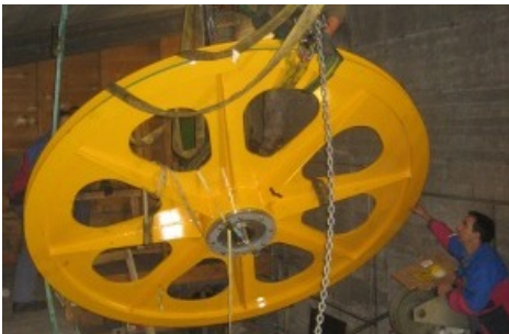
Schilthornbahn AG: Neue Umlenkräder eingebaut. In der Station drinnen muss das Rad an den richtigen Platz manövriert werden. / Weiterer Text ueber ots und auf http://www.presseportal.ch . Die Verwendung dieses Bildes ist fuer redaktionelle Zwecke honorarfrei. Veröffentlichung unter Quellenangabe: "ots.Bild/Schilthornbahn AG".

Diese Meldung kann unter https://www.presseportal.ch/de/pm/100019999/100722254 abgerufen werden.