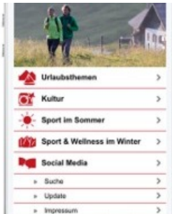
BILD zu TP/OTS - Der persönliche Guide für alle Tirol - Freunde und Wanderfans kann ab sofort im Google Play Store sowie im Apple App Store gratis heruntergeladen werden.

Diese Meldung kann unter https://www.presseportal.ch/de/pm/100014763/100753998 abgerufen werden.