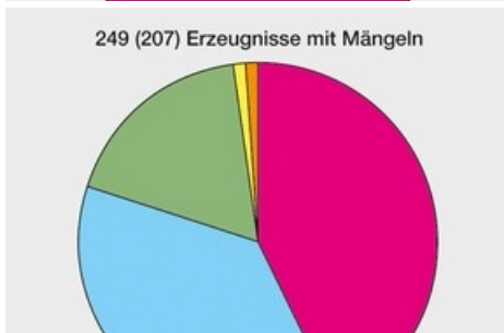
Diagramm Erzeugnisse mit Mängeln. Weiterer Text über ots und www.presseportal.ch/pm/100019965 / Die Verwendung dieses Bildes ist für redaktionelle Zwecke honorarfrei.

Diagramm Kontrollierte Erzeugnisse. Weiterer Text über ots und www.presseportal.ch/pm/100019965 / Die Verwendung dieses Bildes ist für redaktionelle Zwecke honorarfrei.