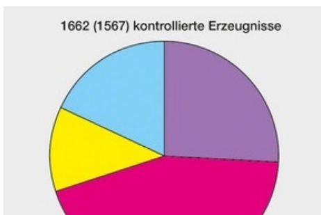
Diagramm Kontrollierte Erzeugnisse. Weiterer Text über ots und www.presseportal.ch/pm/100019965 / Die Verwendung dieses Bildes ist für redaktionelle Zwecke honorarfrei.