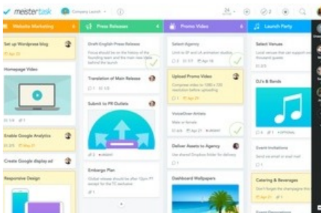
BILD zu OTS - MeisterTask, das intuitive Kollaborationstool der deutsch-österreichischen Firma MeisterLabs, veröffentlicht heute die erste Version seines lang erwarteten Power-Features 'Section Actions', das mithilfe von Automationen für mehr Konstanz, Effizienz und Agilität im Task Management sorgt.