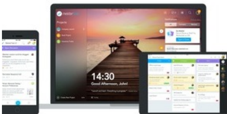
BILD zu OTS - MeisterTask, das intuitive Kollaborationstool der deutsch-österreichischen Firma MeisterLabs, veröffentlicht heute die erste Version seines lang erwarteten Power-Features 'Section Actions', das mithilfe von Automationen für mehr Konstanz, Effizienz und Agilität im Task Management sorgt.

Diese Meldung kann unter https://www.presseportal.ch/de/pm/100058246/100775058 abgerufen werden.