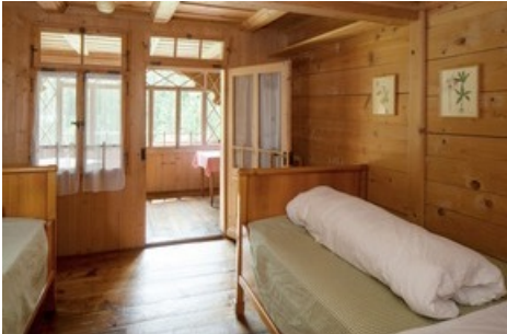
Hotel Waldrand-Pochtenalp, Das historische Hotel des Jahres 2016 / Weiterer Text über ots und www.presseportal.ch/de/nr/100007695 / Die Verwendung dieses Bildes ist für redaktionelle Zwecke honorarfrei.