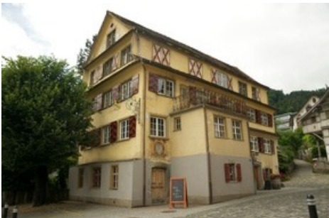
Restaurant Rössli Balgach, Das historische Restaurant des Jahres 2016 / Weiterer Text über ots und www.presseportal.ch/de/nr/100007695 / Die Verwendung dieses Bildes ist für redaktionelle Zwecke honorarfrei.