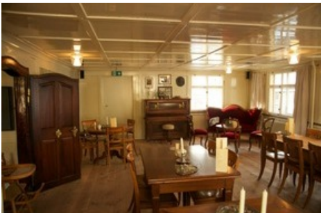
Restaurant Rössli Balgach, Das historische Restaurant des Jahres 2016 / Weiterer Text über ots und www.presseportal.ch/de/nr/100007695 / Die Verwendung dieses Bildes ist für redaktionelle Zwecke honorarfrei.

Diese Meldung kann unter https://www.presseportal.ch/de/pm/100007695/100776966 abgerufen werden.