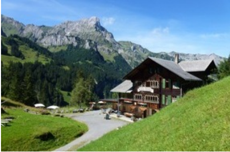
Hotel Waldrand-Pochtenalp, Das historische Hotel des Jahres 2016 / Weiterer Text über ots und www.presseportal.ch/de/nr/100007695 / Die Verwendung dieses Bildes ist für redaktionelle Zwecke honorarfrei.