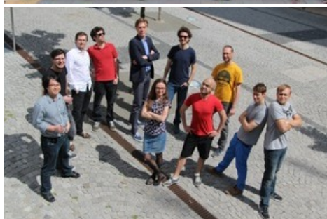
BILD zu OTS - StartUs Team Foto im Juli 2015.