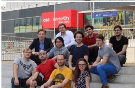
BILD zu OTS - StartUs Team Foto im Juli 2015.

Diese Meldung kann unter https://www.presseportal.ch/de/pm/100058937/100780677 abgerufen werden.