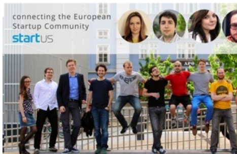
BILD zu OTS - StartUs Team Foto im Juli 2015.