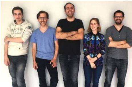
BILD zu OTS - Das Team hinter Teleport

Diese Meldung kann unter https://www.presseportal.ch/de/pm/100060028/100788525 abgerufen werden.