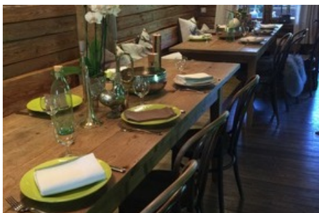
BILD zu TP/OTS - Besonderes Ambiente in der komplett erneuerten "Evelyns Hütte" in Schwarzenberg.