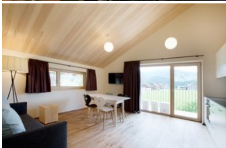
BILD zu TP/OTS - Gäste der neuen "Schtubat" können es sich in von Bregenzerwälder Handwerkern gefertigten Appartements und Zimmern gemütlich machen.