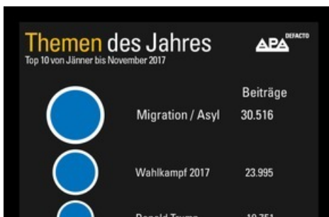
Themen des Jahres

Diese Meldung kann unter https://www.presseportal.ch/de/pm/100018349/100810358 abgerufen werden.