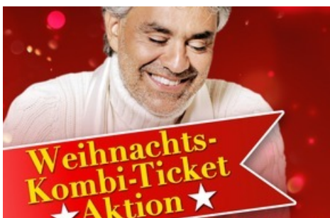
Artwork zu den Andrea Bocelli Konzerten ÖSTERREICH/DEUTSCHLAND/SCHWEIZ