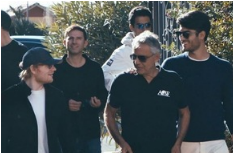
BILD zu OTS - Ed Sheeran und Andrea Bocelli

Diese Meldung kann unter https://www.presseportal.ch/de/pm/100063570/100810476 abgerufen werden.