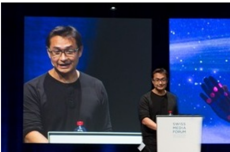
Weiterer Text über ots und www.presseportal.ch/de/nr/100053570/ / Die Verwendung dieses Bildes ist für redaktionelle Zwecke honorarfrei.

Diese Meldung kann unter https://www.presseportal.ch/de/pm/100053570/100818747 abgerufen werden.