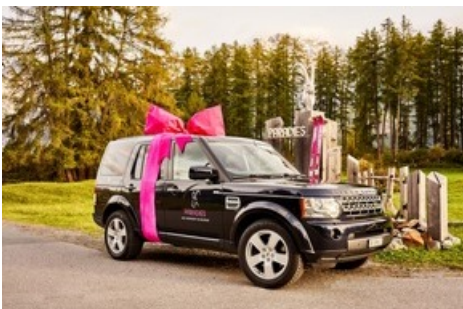
Bequemer geht's nimmer: Privatchauffeur holt Gäste kostenlos ab