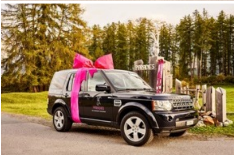
Der Weg ist das Ziel: neu holt ein Privatchauffeur Gäste von zu Hause ab und bringt sie direkt ins «Paradies».