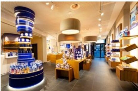
Pour la première fois en Suisse, une maison NIVEA avec une boutique phare associé ouvre ses portes à a-ja Resort Zurich