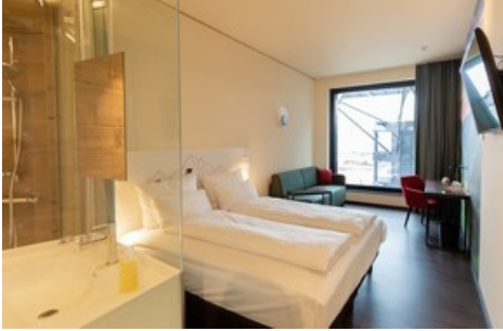
Chambre double supérieure à a-ja City-Resort à Zurich