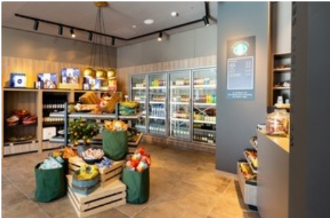
Boutiques pour les petits achats