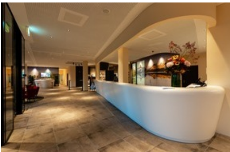
L'entrée de l'a-ja City-Resort à Zurich