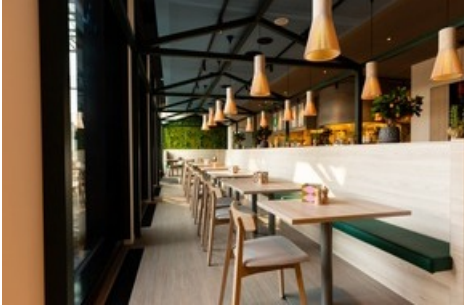
Le restaurant DELI accueille aussi bien les clients de l'hôtel que les clients externes