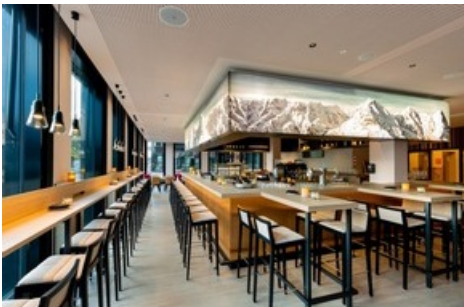
Le bar de l'hôtel est le lieu parfait pour finir la journée autour d'un bon verre

Diese Meldung kann unter https://www.presseportal.ch/de/pm/100018582/100821406 abgerufen werden.