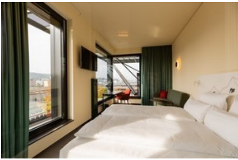
Chambre double de luxe au a-ja City-Resort à Zurich