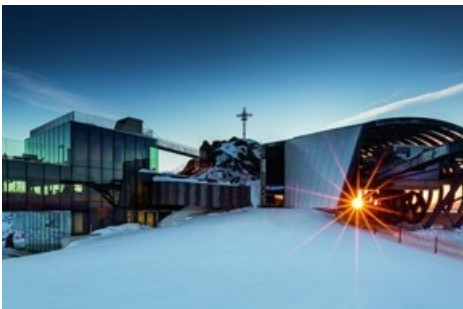
BILD zu OTS - Das Hotel Edelweiss feiert die Eröffnung des Bondmuseums 007 ELEMENTS in Sölden mit Casino-Royalabenden im Hotel, elegantem Galadinner und hochwertigen Ski Tests.