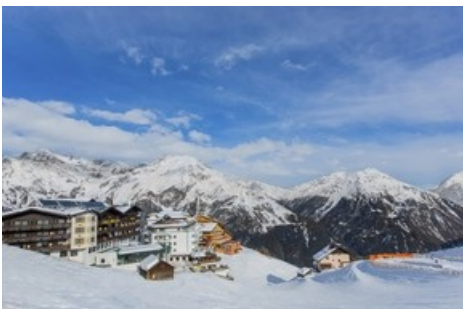
BILD zu OTS - Das Hotel Edelweiss feiert die Eröffnung des Bondmuseums 007 ELEMENTS in Sölden mit Casino-Royalabenden im Hotel, elegantem Galadinner und hochwertigen Ski Tests.