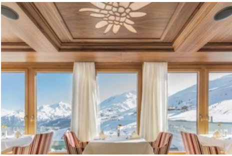
BILD zu OTS - Das Hotel Edelweiss feiert die Eröffnung des Bondmuseums 007 ELEMENTS in Sölden mit Casino-Royalabenden im Hotel, elegantem Galadinner und hochwertigen Ski Tests.