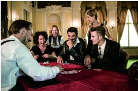
BILD zu OTS - Das Hotel Edelweiss feiert die Eröffnung des Bondmuseums 007 ELEMENTS in Sölden mit Casino-Royalabenden im Hotel, elegantem Galadinner und hochwertigen Ski Tests.

Diese Meldung kann unter https://www.presseportal.ch/de/pm/100062202/100822399 abgerufen werden.