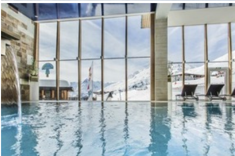
BILD zu OTS - Das Hotel Edelweiss feiert die Eröffnung des Bondmuseums 007 ELEMENTS in Sölden mit Casino-Royalabenden im Hotel, elegantem Galadinner und hochwertigen Ski Tests.