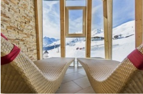
BILD zu OTS - Das Hotel Edelweiss feiert die Eröffnung des Bondmuseums 007 ELEMENTS in Sölden mit Casino-Royalabenden im Hotel, elegantem Galadinner und hochwertigen Ski Tests.