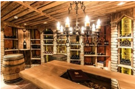
BILD zu OTS - Das Hotel Edelweiss feiert die Eröffnung des Bondmuseums 007 ELEMENTS in Sölden mit Casino-Royalabenden im Hotel, elegantem Galadinner und hochwertigen Ski Tests.