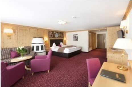
BILD zu OTS - Das Hotel Edelweiss feiert die Eröffnung des Bondmuseums 007 ELEMENTS in Sölden mit Casino-Royalabenden im Hotel, elegantem Galadinner und hochwertigen Ski Tests.