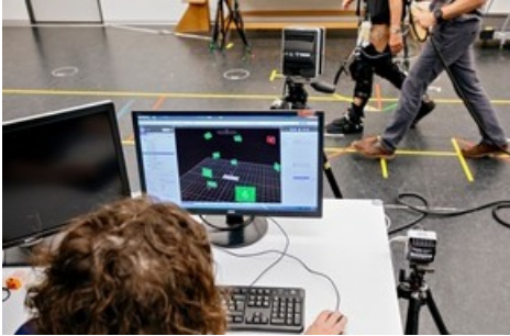
XoSoft: Soft-Exoskelett unterstützt Menschen mit eingeschränkter Mobilität