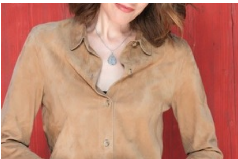
Die Walliser Sängerin Sina