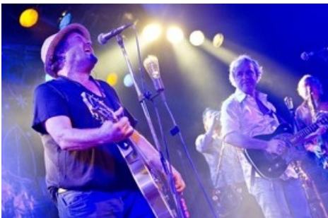
Die legendäre Berner Mundart Band Patent Ochsner