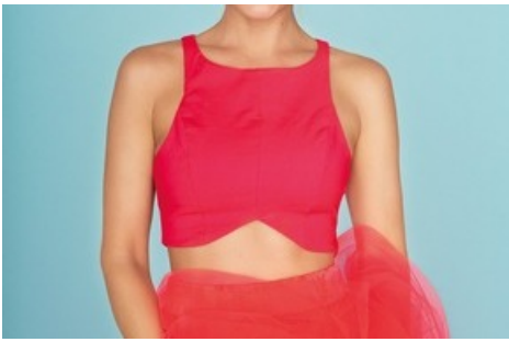
Christa Rigozzi