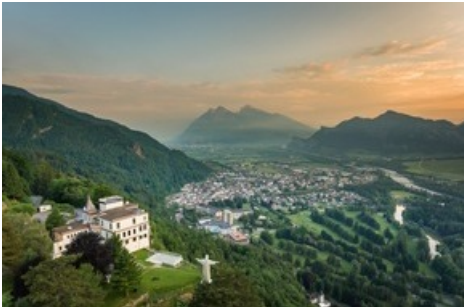
Blick von Wartenstein auf Bad Ragaz und Umgebung