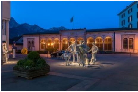
Die Ruhe vor dem Sturm: Rund um das Alte Dorfbad im Dorfkern von Bad Ragaz wird das Festzentrum des 12. Nationalen Wandertags der «Schweizer Familie» zu stehen kommen.