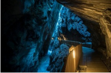
Die Thermalwasser-Wanderung führt unter anderem in die Taminaschlucht