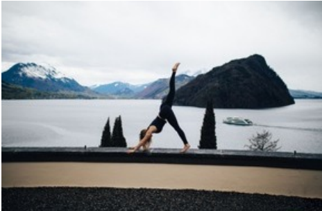
Der Vierwaldstättersee ist die perfekte Kulisse für ein Wochenende im Yoga-Flow.