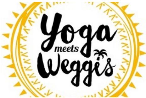
Logo «Yoga meets Weggis»

Diese Meldung kann unter https://www.presseportal.ch/de/pm/100018582/100831878 abgerufen werden.