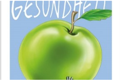
Cover HSG Focus 3/2019

Diese Meldung kann unter https://www.presseportal.ch/de/pm/100003729/100832061 abgerufen werden.