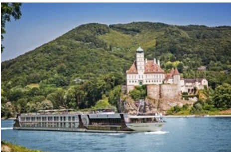
Excellence Princess. Weiterer Text über ots und www.presseportal.ch/de/nr/100018141 / Die Verwendung dieses Bildes ist für redaktionelle Zwecke honorarfrei.