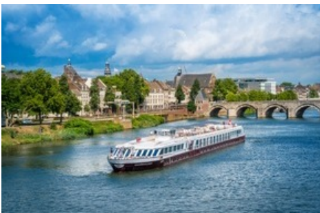
Excellence Pearl. Weiterer Text über ots und www.presseportal.ch/de/nr/100018141 / Die Verwendung dieses Bildes ist für redaktionelle Zwecke honorarfrei.