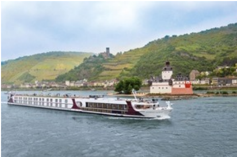
Excellence Countess. Weiterer Text über ots und www.presseportal.ch/de/nr/100018141 / Die Verwendung dieses Bildes ist für redaktionelle Zwecke honorarfrei.