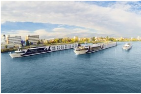
Excellence Trio auf dem Rhein. Weiterer Text über ots und www.presseportal.ch/de/nr/100018141 / Die Verwendung dieses Bildes ist für redaktionelle Zwecke honorarfrei.