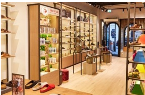
Das Traditionsunternehmen öffnet am 24. Oktober erstmals seine Türen auf der Kärntner Straße (Bildnutzung freigegeben zur einmaligen redaktionellen Verwendung im Rahmen der Berichterstattung über das Store Opening in Wien). Weiterer Text über ots und www.presseportal.de/nr/110692