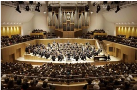
Ein Highlight im Jubiläumsjahr 2020: Die Bamberger Symphoniker spielen im Herbst in der Bamberger Konzerthalle zu den runden Geburtstagen von Twerenbold und Beethoven auf.