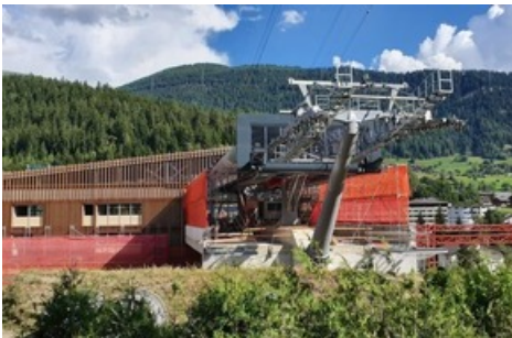
F1 - der neue ÖV-Hub in Fiesch: Zug, Bergbahn und Postauto vereint. □ 30.8.2019