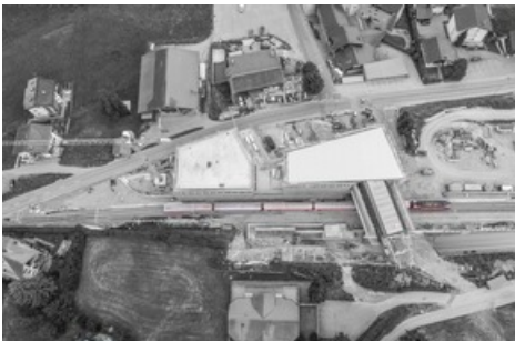
F1 - der neue ÖV-Hub in Fiesch: Zug, Bergbahn und Postauto vereint. □ 6.8.2019 - Chris Langemeijer