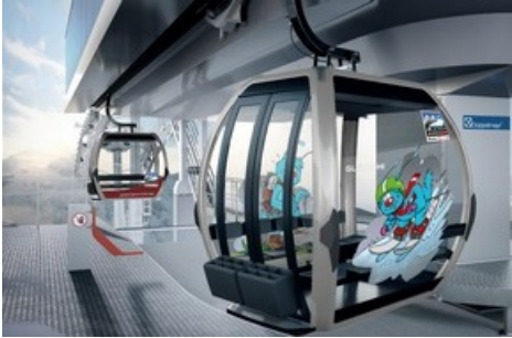
Die Gondelbahn Fiesch-Fiescheralp ist mit OMEGA V-Kabinen - der neuesten Kabinengeneration der CWA Constructions SA in Olten - ausgestattet. hier: die exklusiv kreierte Gletschi-Gondel