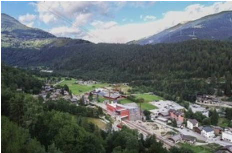
F1 - der neue ÖV-Hub in Fiesch: Zug, Bergbahn und Postauto vereint. □ 6.8.2019 - Chris Langemeijer