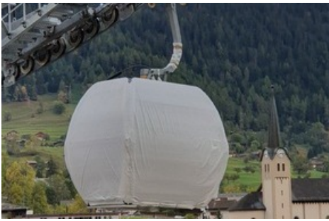
Die ersten Gondeln der neuen 10er Gondelbahn Fiesch - Fiescheralp hängen bereits. Der Eröffnungs-event naht. 7.12.2019 □ 18.10.2019