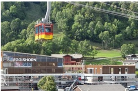
Alt und Neu: Die alte Luftseilbahn Fiesch - Fiescheralp "fliegt" über den neuen ÖV-Hub in Fiesch. Die alte Luftseilbahn wird im Frühling 2020 zurückgebaut.