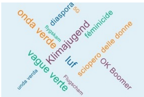
Wörter des Jahres 2019