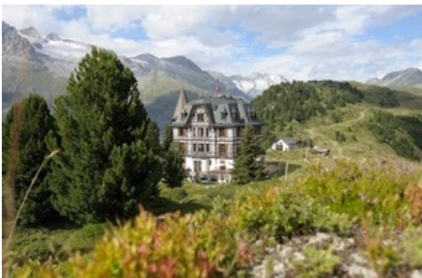
Seit über 40 Jahren beherbergt das geschichtsträchtige Haus die führende Naturschutzorganisation der Schweiz – Pro Natura.