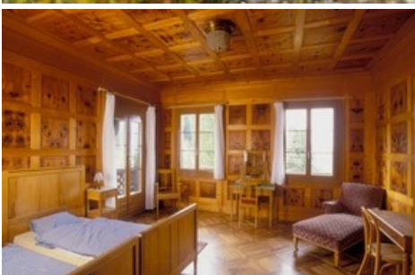
Der britische Bankier Sir Ernest Cassel weihte 1902 sein Sommer-Ferendomizil auf der Riederfurka ein. Sein viktorianisches Refugium über dem Grossen Aletschgletscher.