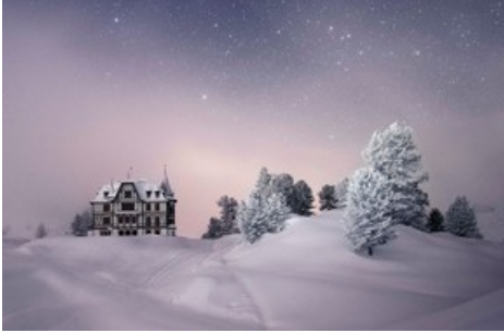
Die Villa Cassel - Viktorianische „Fata Morgana“ hoch über dem Aletschgletscher