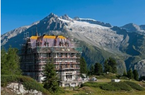
Nach aufwändigen Sanierungsarbeiten wird die Villa am 12. Juni 2020 wiedereröffnet – jetzt klimaneutral.