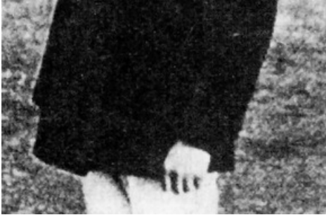
Der junge Winston Churchill zählt sicherlich zu den heute bekanntesten Gästen des Sir Cassel. 1904 war Churchill das erste Mal zu Gast in der Villa Cassel.