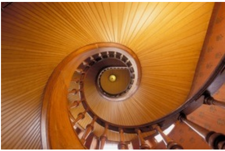
Der britische Bankier Sir Ernest Cassel weihte 1902 sein Sommer-Ferendomizil auf der Riederfurka ein. Sein viktorianisches Refugium über dem Grossen Aletschgletscher.