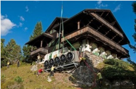
Das Chalet Cassel mit der neuen Luft-Wasser-Wärmepumpe.