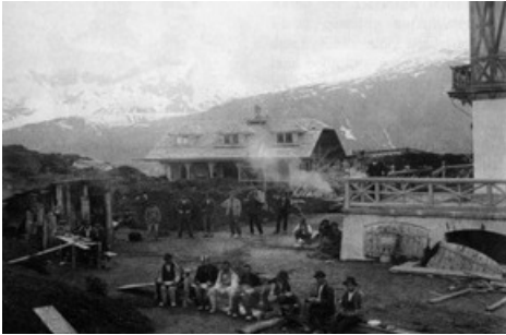
Der Bankier Sir Ernest Cassel liess die Villa Ende 19. Jahrhundert erbauen. Für den Bau der Villa galt es 1300 Meter von Mörel auf die Riederfurka zu überwinden - ohne Seilbahn. Maultiere schleppten Material und Menschen auf ihren Rücken den Berg hinauf.

Diese Meldung kann unter https://www.presseportal.ch/de/pm/100070233/100838300 abgerufen werden.