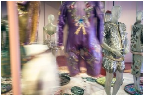
"Mode Circus Knie - Kostüme aus 100 Jahren".