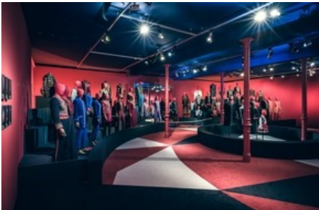
Zirkuskostüme aus den Jahren 1990 - 2018.