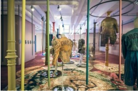
"Mode Circus Knie": Clown-Kostüme vom Beginn des 20. Jahrhunderts.