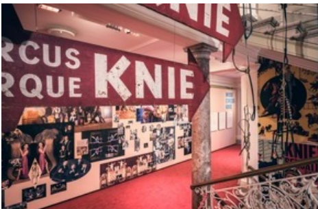
"Mode Circus Knie".