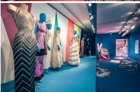
Zirkuskostüme aus den 1970- und 1980-Jahren.