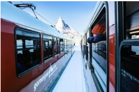
Züge der Gornergrat Bahn vor dem Matterhorn