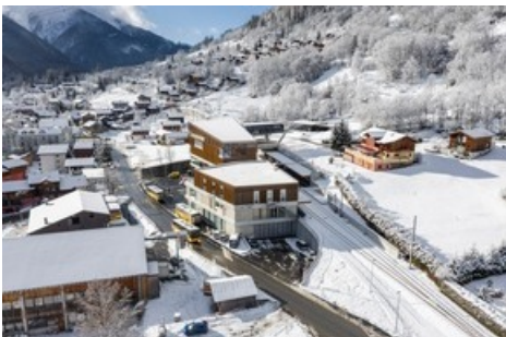
Zug- und Bus-Terminal und direkter Zugang zu den neuen Gondeln um auf die Fiescheralp zu gelangen vereint im neuen ÖV-Hub in Fiesch