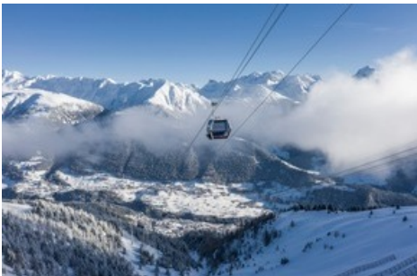
Schneller auf der Pistel Mit dem neuen ÖV-Hub und der schnellsten Gondelbahn der Schweiz.