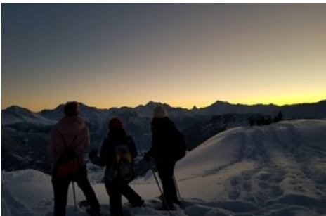
Eine geführte Schneeschuh-Tour durch die UNESCO-gekrönte Landschaft der Aletsch Arena ist ein einzigartiges Naturerlebnis. NEU Silent Walk: Geniessen erlaubt, Reden nicht.

Diese Meldung kann unter https://www.presseportal.ch/de/pm/100070233/100841347 abgerufen werden.