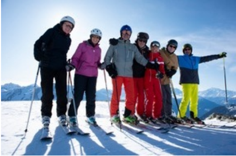
Senioren auf die Piste! Dank dem neuen Angebot der Skischule Bettmeralp haben Senioren die Möglichkeit Ski Unterricht nach ihren Bedürfnissen zu erhalten