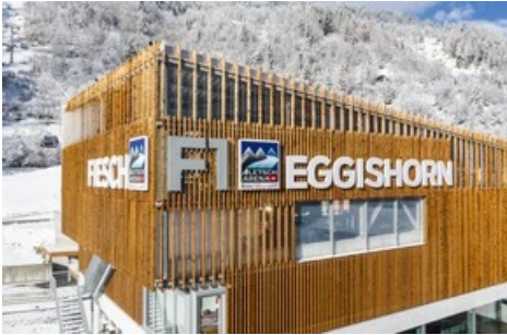
Neuer ÖV-Hub in Fiesch