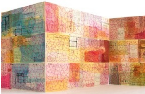
Judith Mundwiler: NETZWERK IM FLUSS DER ZEIT (Detail), 2017 / Foto: Künstlerin