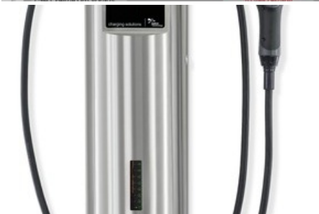
Der JUICE CHARGER 2 mit Kreditkartenzahlungsfunktion.

Diese Meldung kann unter https://www.presseportal.ch/de/pm/100066878/100845480 abgerufen werden.