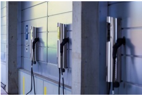
Der JUICE CHARGER 2 mit Kreditkartenzahlungsfunktion