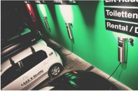
Das rocksresort Laax hat bereits 25 JUICE CHARGER 2 erfolgreich in Betrieb. Sechs weitere sind geplant.