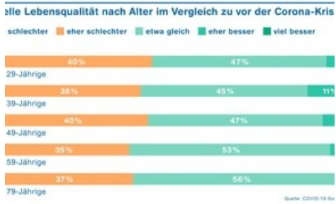
Aktuelle Lebensqualität nach Alter im Vergleich zu vor der Corona-Krise

Diese Meldung kann unter https://www.presseportal.ch/de/pm/100018827/100846137 abgerufen werden.