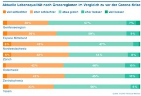
Aktuelle Lebensqualität nach Grossregionen im Vergleich zu vor der Corona-Krise