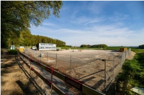
Bohrplatz Trüllikon Aktuell