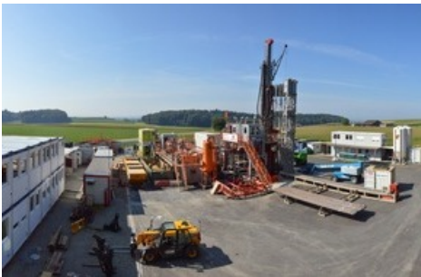
Bohrplatz Trüllikon Panorama