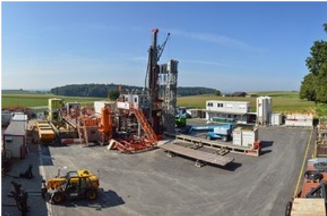
Der Bohrplatz Trüllikon.