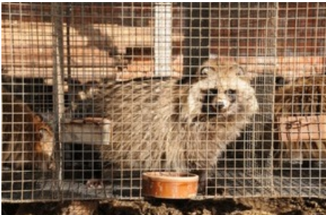
Auf Pelzfarmen werden tausende Tiere wie Nerze, Marderhunde oder Füchse unter tierquälerischen Bedingungen in winzige Drahtkäfige gepfercht