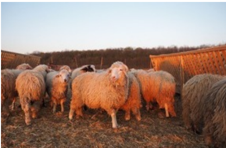
Die geretteten Schafe sind nun in einer speziell umgebauten Pferdefarm nördlich von Bukarest untergebracht.