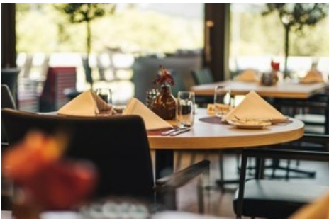
Restaurant Gladys im Golf Club Bad Ragaz