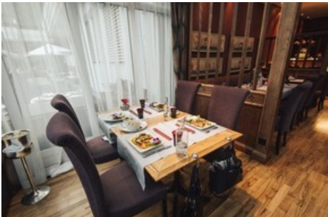
Restaurant Namun