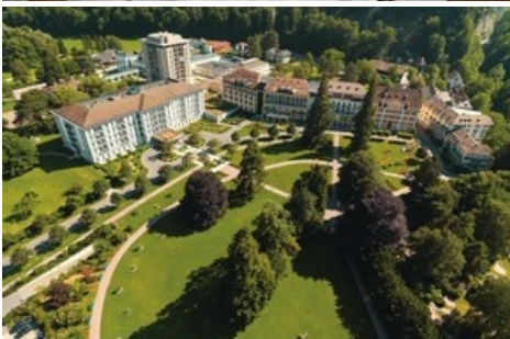
Grand Resort Bad Ragaz