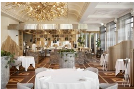
Sven Wassmers Restaurant Memories