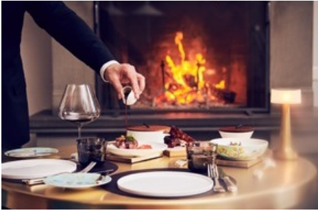
Restaurant IGNIV by Andreas Caminada

Diese Meldung kann unter https://www.presseportal.ch/de/pm/100055636/100847308 abgerufen werden.