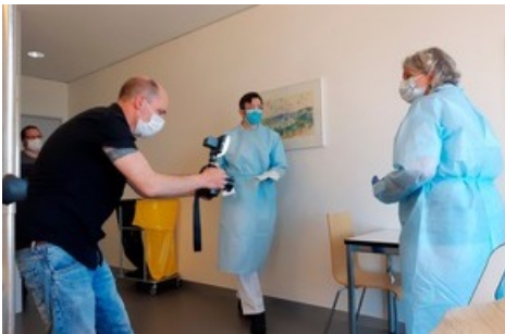
Bei den Schulungsvideos übernahm die Initiantengruppe gleich selbst die Statisten-Rollen in den Videos.