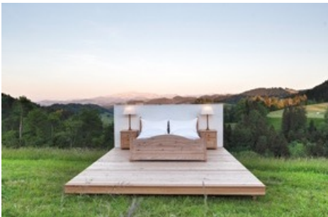
HOHLENSTEIN SUITE (900 m.ü.M.), Tourismusregion Thurgau, Gemeinde Au-Fischingen: Die immobilienbefreite Suite liegt auf einer der schönsten Alpenwiesen, im hintersten Zipfel des Thurgaus, mit Ausblick über das Tannzapfenland bis zum Alpstein. Die «Modern Butler» sind von einem Biohof. Das Back-up-Zimmer bei schlechtem Wetter ist 250 Meter distanziert.