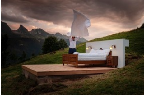
BURST SUITE (1220 m.ü.M.), Tourismusregion Toggenburg, Gemeinde Wildhaus Alt-St.Johann: Die immobilienbefreite Suite liegt in einem Hang, mit Ausblick zu den atemberaubenden Churfürsten, dem Alpstein und dem St.Galler Rheintal. Die «Modern Butler» ist ein Agrotouristiker-Paar. Das Back-up-Zimmer bei schlechtem Wetter ist 150 Meter distanziert.