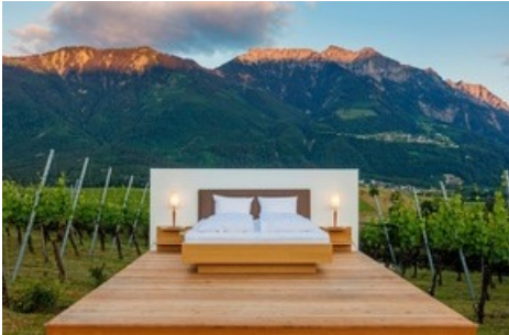
FÜRSTEN SUITE (457 m.ü.M.), Tourismusregion Liechtenstein, Gemeinde Eschen: Die immobilienbefreite Suite thront vor dem Hausberg der «Drei Schwestern» in die Landschaft hinein, mit Dreiländerblick nach Österreich und die Schweiz. Die «Modern Butlerin» ist eine professionelle «Bügelfee». Das Back-up-Zimmer bei schlechtem Wetter ist 50 Meter distanziert.