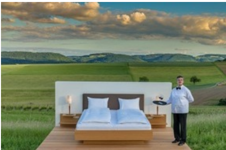
PINOT SUITE (403 m.ü.M.), Tourismusregion Schaffhauserland, Gemeinde Trasadingen: Die immobilienbefreite Suite liegt oberhalb eines Rebberges, mitten in einer Feldwiese, mit Aussicht in eine bezaubernde und malerische Landschaft. Die «Modern Butler» kommen aus der lokalen Umgebung des Dorfes Trasadingen. Das Back-up-Zimmer bei schlechtem Wetter ist 50 Meter distanziert.