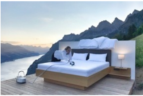
LÜSIS SUITE (1300 m.ü.M.), Tourismusregion Heidiland, Gemeinde Walenstadt: Die immobilienbefreite Suite befindet sich auf einem Hochplateau, mit Aussicht auf den Walensee, die Glarner Alpen und das Sarganserland. Die «Modern Butler» sind das Tochter-Mutter-Gespann vom Berggasthaus Lüsis. Das Back-up-Zimmer bei schlechtem Wetter ist 150 Meter distanziert.