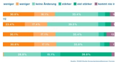
und der aktuellen Corona-Krise bevorzugte Transportmittel für Reisen