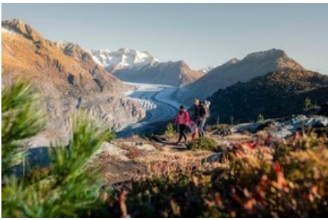
Aletsch Arena Familien willkommen