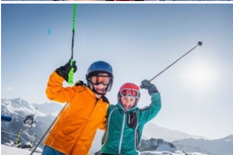
Aletsch Arena Familien willkommen