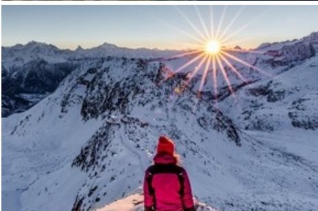
Aletsch Arena Winterstimmung am Grossen Aletschgletscher