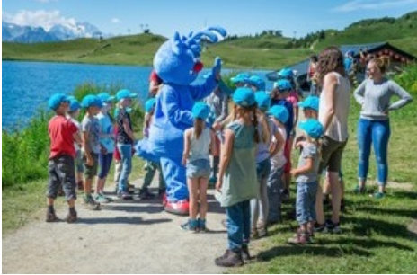
Aletsch Arena Familien willkommen