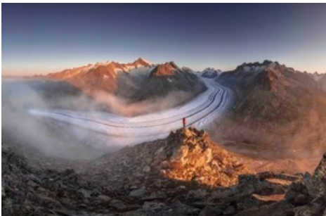
Aletsch Arena am Grossen Aletschgletscher, dem grössten Gletscher der Alpen.