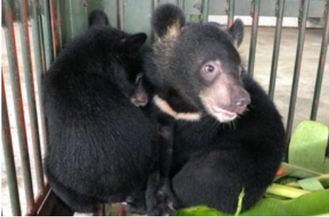
Die zwei geretteten Bärenjungen