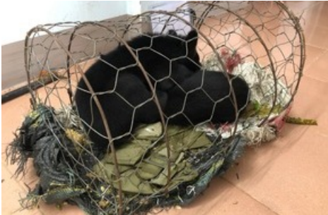
Das Leben in einem kleinen Käfig gehört zum Glück der Vergangenheit an.

Diese Meldung kann unter https://www.presseportal.ch/de/pm/100004691/100852784 abgerufen werden.