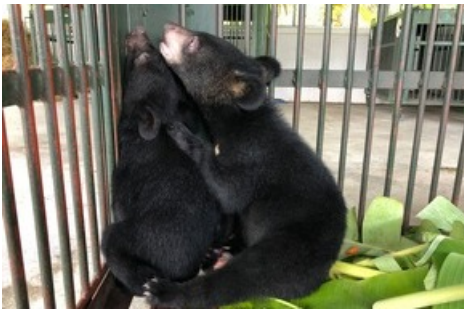
Die Bären waren in einem kleinen Käfig gefangen.