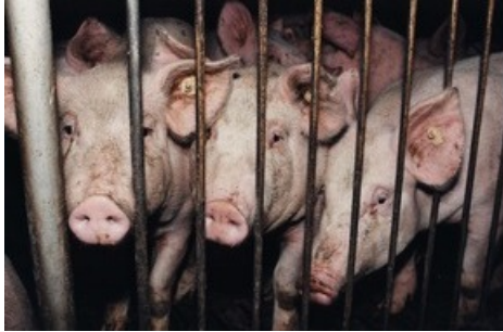
Durch die Reduzierung der Fleischproduktion kann Tierleid vermindert werden.

Diese Meldung kann unter https://www.presseportal.ch/de/pm/100004691/100853053 abgerufen werden.