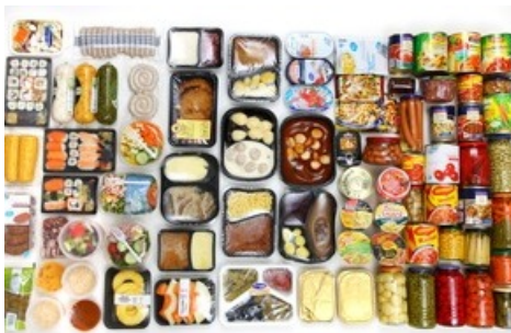
Fertigprodukte, deren Produzenten im VIER PFOTEN Ranking bewertet worden sind.