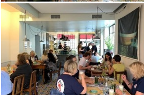
Der tierfreundliche Brunch-Talk in vollem Gange.