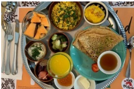
Lauren Wildbolz zauberte zusammen mit ihrem Team im Restaurant Maison Raison orientalische Brunch-Spezialitäten auf den Tisch