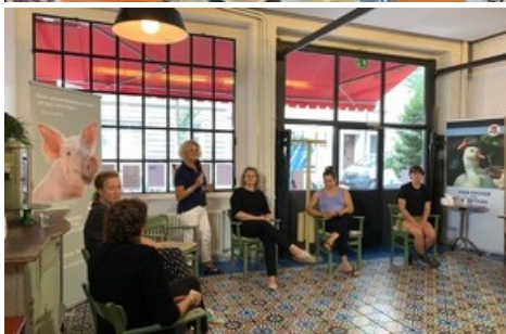
Die Talkrunde startet