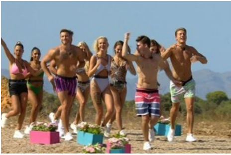
Die Islander. Weiterer Text über ots und www.presseportal.de/nr/6605 / Die Verwendung dieses Bildes ist für redaktionelle Zwecke honorarfrei. Veröffentlichung bitte unter Quellenangabe: "obs/RTLZWEI"