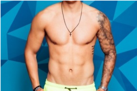
Tim. Weiterer Text über ots und www.presseportal.de/nr/6605 / Die Verwendung dieses Bildes ist für redaktionelle Zwecke honorarfrei. Veröffentlichung bitte unter Quellenangabe: "obs/RTLZWEI/Magdalena Possert"