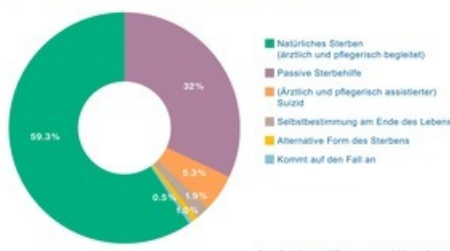
Wie Hausärztinnen und -ärzte Sterbefasten klassifizieren