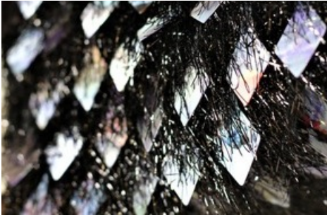
Vision Herbst Winter 2021/22. Schweizer Textilhersteller präsentieren sich in der Lounge des Textilmuseums: Jakob Schlaepfer, St. Gallen