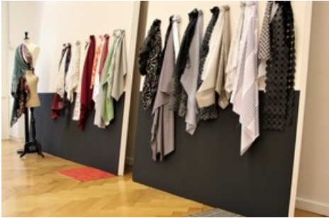
Vision Herbst Winter 2021/22. Schweizer Textilhersteller präsentieren sich in der Lounge des Textilmuseums.