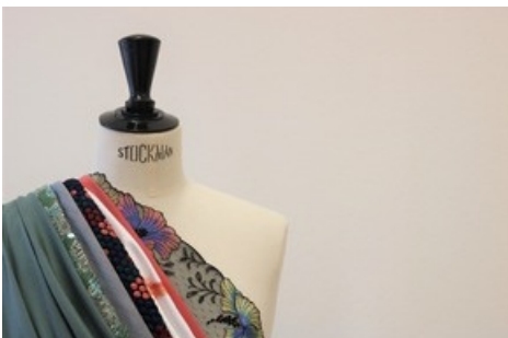
Vision Herbst Winter 2021/22. Schweizer Textilhersteller präsentieren sich in der Lounge des Textilmuseums.