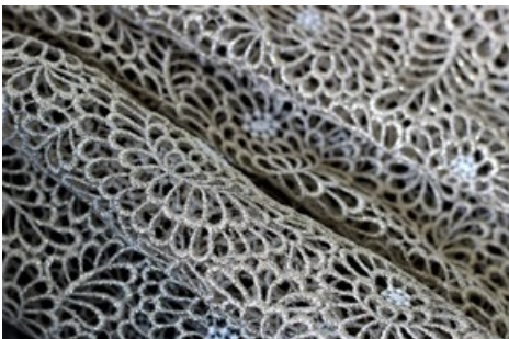
Vision Herbst Winter 2021/22. Schweizer Textilhersteller präsentieren sich in der Lounge des Textilmuseums: Union AG, St.Gallen