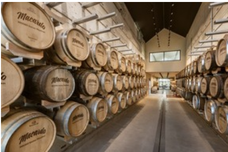
Fasslager 4.0