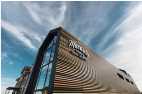
Wie der Neubau von Macardo ist keine andere Destillerie konzipiert.