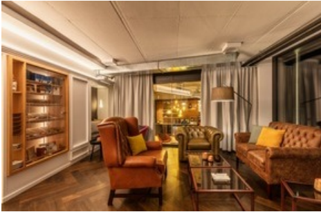
Cigar Lounge