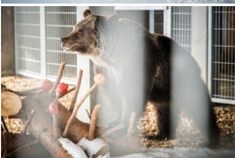
Neugierig erkundet Jambolina die neue Umgebung.