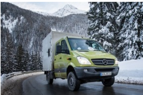
Der Transporter bringt die Bärin nach Arosa.