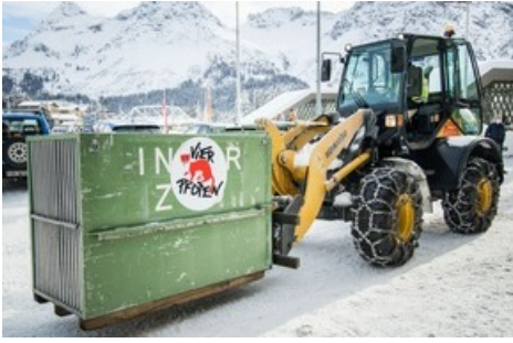
Jambolina wird zur Luftseilbahn Arosa Weisshorn transportiert.