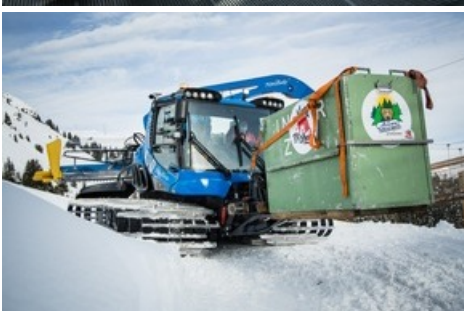
Mit dem Pistenbully wurde Jambolina endgültig in ihr neues Zuhause auf über 2'000 Meter über Meer gebracht.