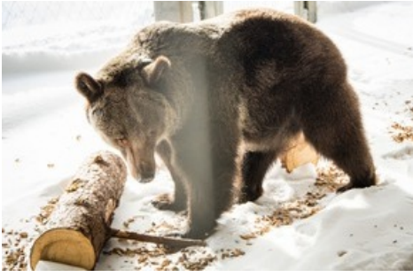
Neugierig erkundet Jambolina die neue Umgebung.

Diese Meldung kann unter https://www.presseportal.ch/de/pm/100004691/100861702 abgerufen werden.