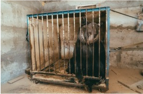
Die Braunbärin wurde seit Monaten in einer kleinen Transportkiste aus Metall gehalten.