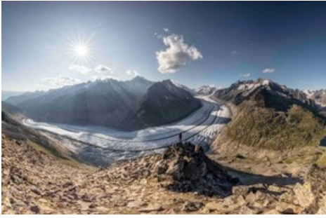
Aletsch Arena - digital und analog ein einzigartiges Erlebnis

Diese Meldung kann unter https://www.presseportal.ch/de/pm/100070233/100861948 abgerufen werden.